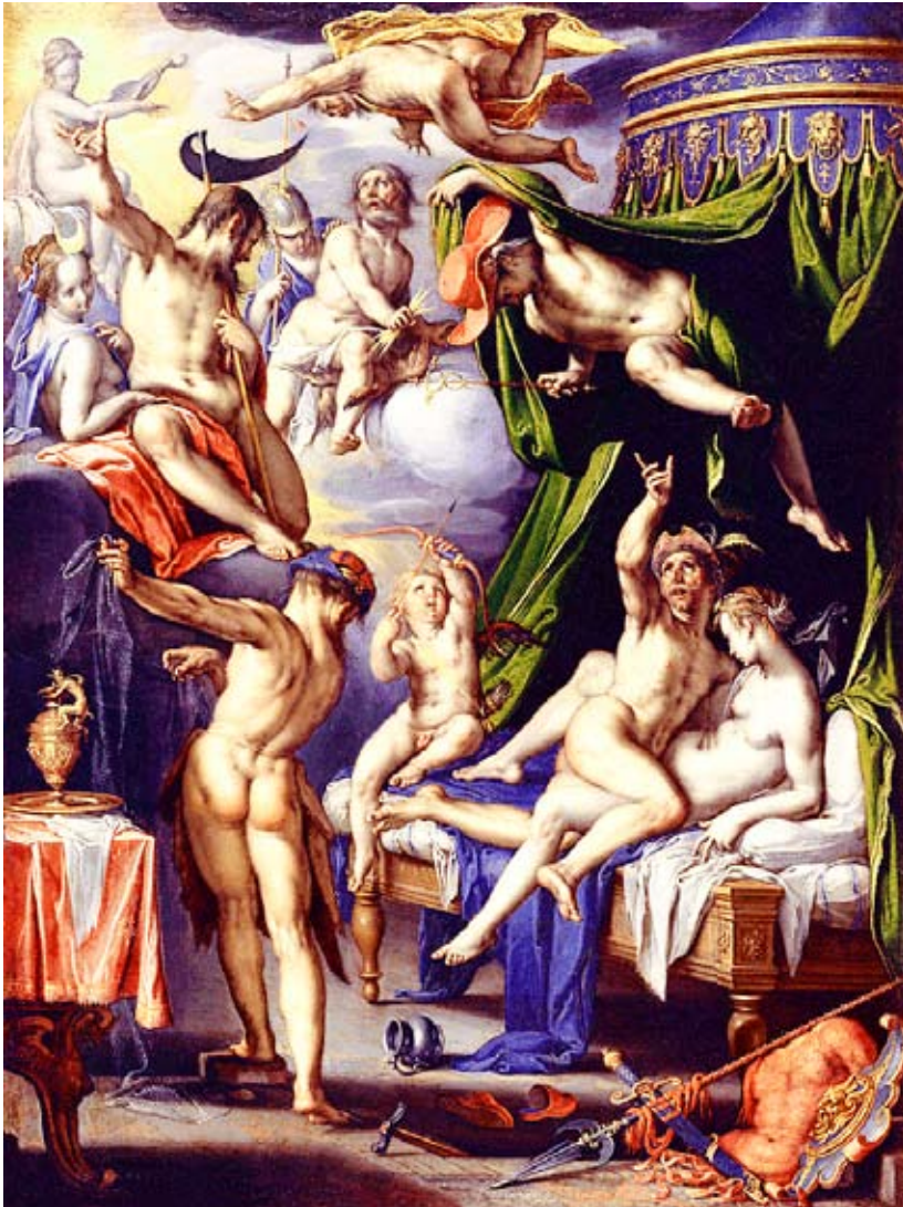
Joachem Wtewael: "Vulkanus yllättää Marsin ja Venuksen", 1601.

näisen taistelunsa ja alistuneet saman herran eli hengen palvelukseen. Astrologiassa niin Venus kuin Marskin hallitsevat kahta eläinradan merkkiä. Härän Venus on eeerisen kaksoispuolen hallitsija. Hänet kuvataan käsissään palava sydän ja naamio. Vihkimyksessä tämä alempi Venus muuttuu korkeammaksi Vaa'an Venukseksi, joka kuvataan pitelemässä vaakaa sisäisen tasapainon merkinä. Vaa'an Venus on myös ihmisen korkeamman mielen hallitsija.