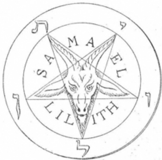
Pentagrammeja Stanislas de Guaitan teoksesta La Clef de la Magie Noire (1897)